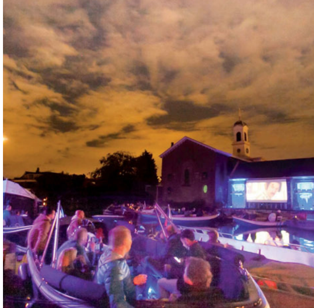
Drijf in de Schie

Opzomeren: Schoonmaakactie in de straat, opknappen van geveltuinen in de straat, een straatfeest, voorlezen aan kinderen, een Lief en Leedactie in de flat