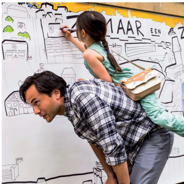
Urban Village Schepenstraat

Citylab: Stedelijke Schaatsbaan, Luchtsingel, Taaltuin Spangen, Cultuurwerkplaats, Debat010, Slimdak (wateropvang dakpalvijloen Schieblock)