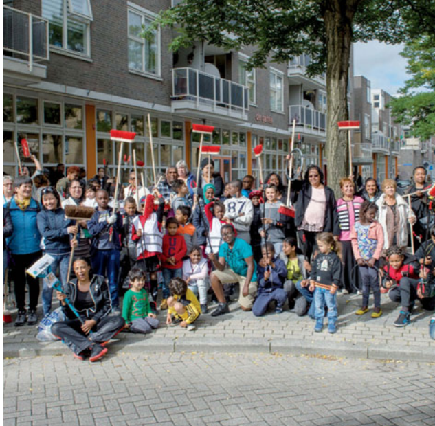
Schoonmaakactie Oude Westen

Opzomeren: Schoonmaakactie in de straat, opknappen van geveltuinen in de straat, een straatfeest, voorlezen aan kinderen, een Lief en Leedactie in de flat